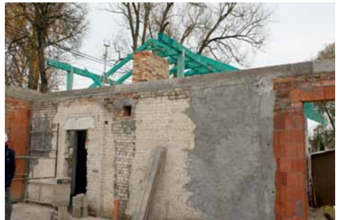
Świetlica wiejska - w remoncie