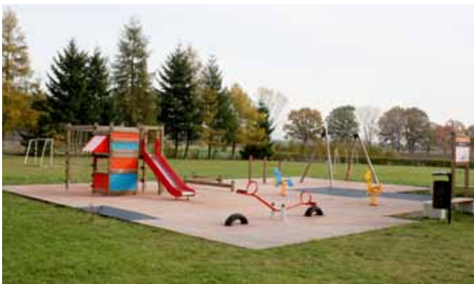
Plac zabaw przy szkole podstawowej