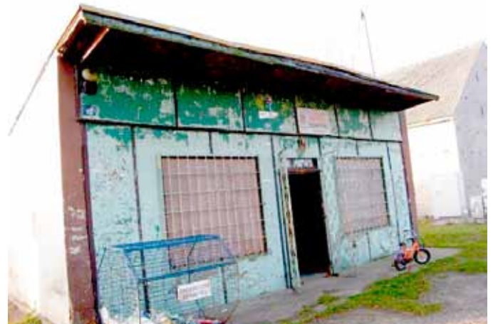
Świetlica przed remontem