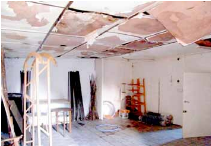
Świetlica przed remontem