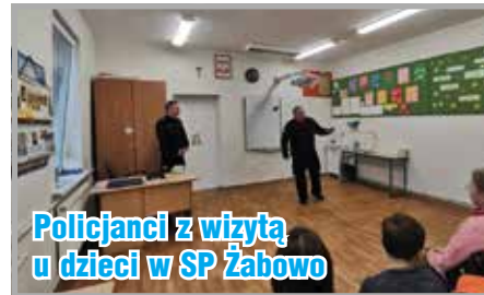
Policjanci z wizytą u dzieci w SP Żabowo