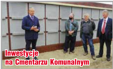
Inwestycje na Cmentarzu Komunalnym