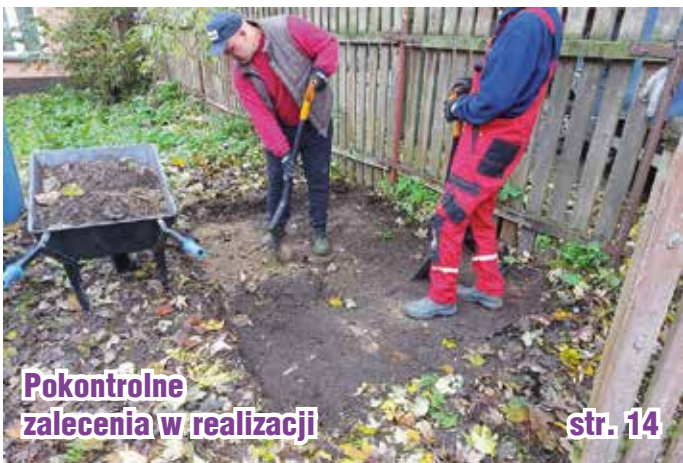
Pokontrolne zalecenia w realizacji