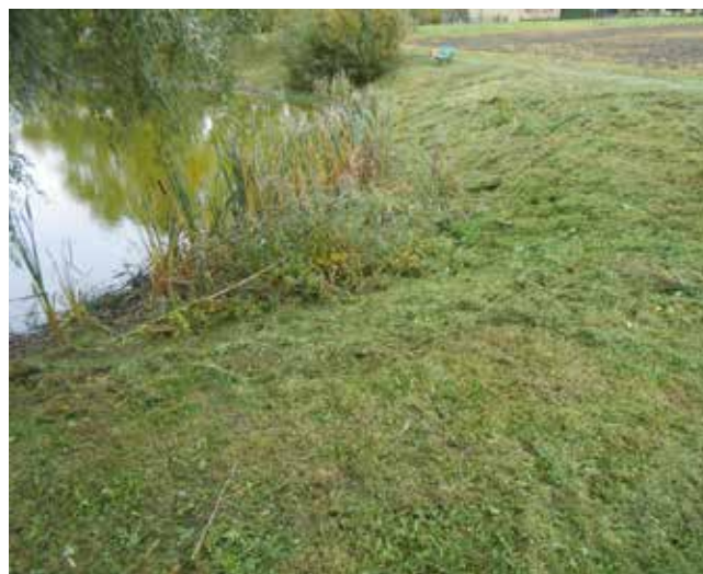
Obkaszanie stawu przy Osiedlu Radostawa