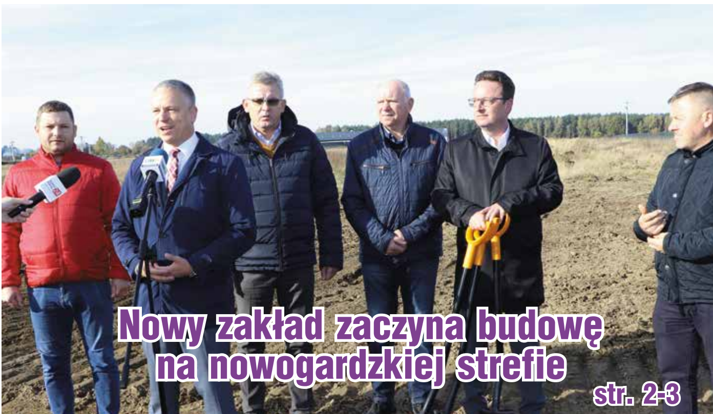
Nowy zakład zaczyna budowę na nowogardzkiej strefie