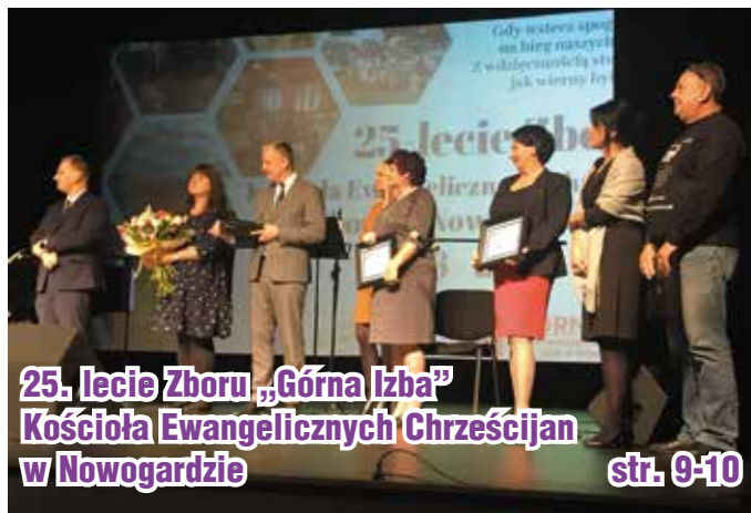
25. lecie Zboru „Górna Izba” Kościoła Ewangelicznych Chrześcijań w Nowogardzie