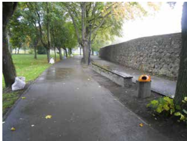
Zamiatanie liści pod murami.