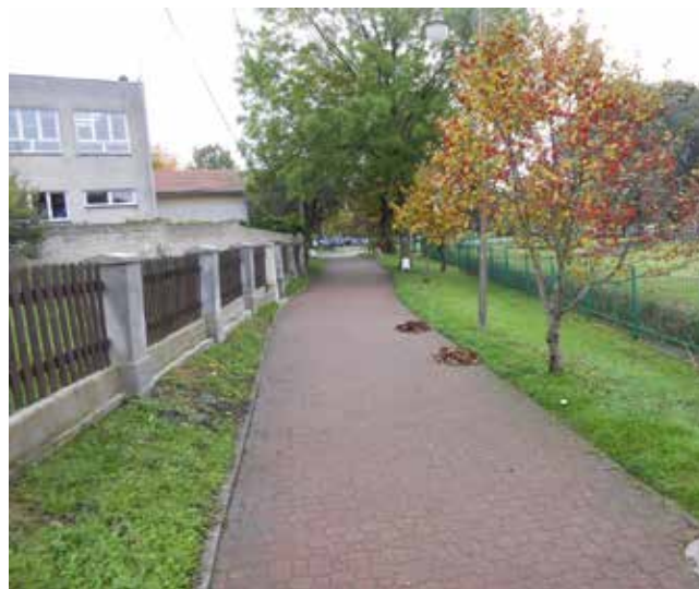
Grabienie liści - Promenada