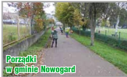
Porządki w gminie Nowogard