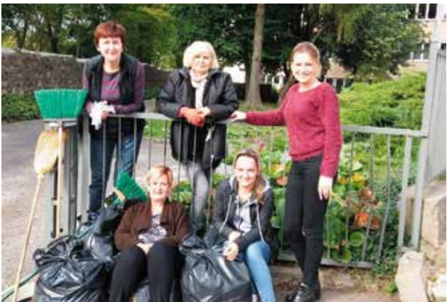
Pracownicy biblioteki nowogardzkiej