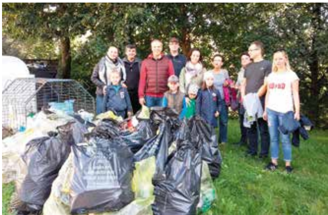
Pracownicy Urzędu Miejskiego

Dziękujemy bardzo za zaangażowanie się w tegoroczną akcję Sprzątania Świata. Zachęcamy do uprzątnięcia otoczenia w sąsiedztwie naszych domów, skwerów, placów zabaw bo właśnie takim postępowaniem dajemy dobry przykład a zarazem przyczyniamy się do dbania o nasze środowisko!